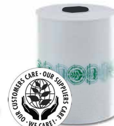
BIO (20 µm) Home-kompostierbar