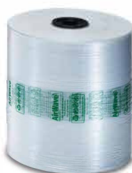
Super ECO (12 µm)