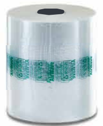
Heavy Duty (26 µm)