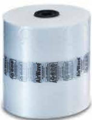
Standard (20 µm)