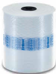
ECO (15 µm)