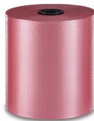
ESD (20 µm) Antistatisch